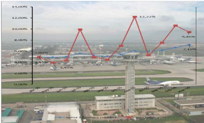
Gráfico 1: Tasa de Crecimiento 2016 v/s 2015

NOTA: La variación del año 2016 c/r al año 2015 se realiza con los datos recabados hasta Diciembre en ambos periodos.