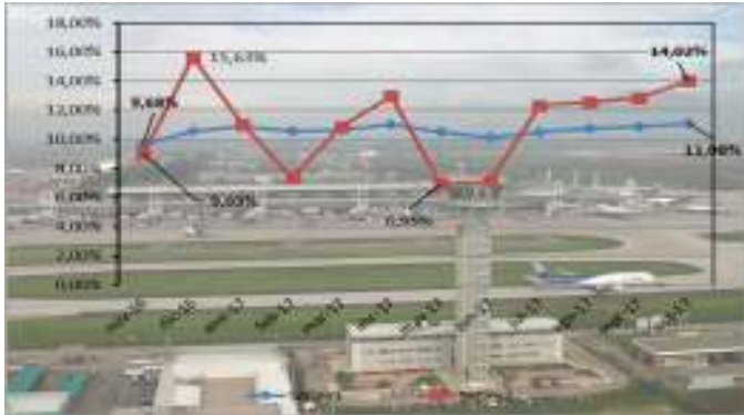
Gráfico 1: Tasa de Crecimiento 2017 v/s 2016

(*) La variación del año 2017 c/r al año 2016 se realiza con los datos recabados hasta Diciembre en ambos períodos.