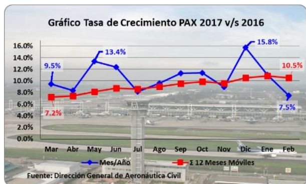
Gráfico 1: Tasa de Crecimiento 2017 v/s 2016

NOTA: La variación del año 2017 c/r al año anterior se realiza con los datos consolidados hasta febrero en ambos años.