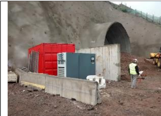
Sector de polvorín del Portal Norte