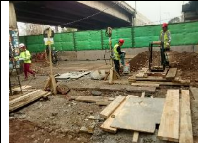
Vista de los trabajos de la cepa N°1