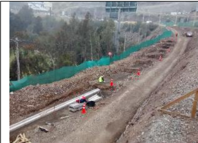
Entre Dm 115 y 0.50 donde se está prepara sello e instalan soleras