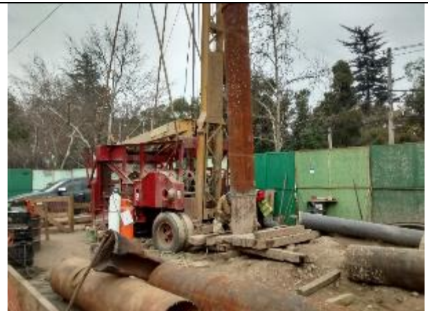
Pozo N°02, maquinaria perforadora percutora trabajando con normalidad