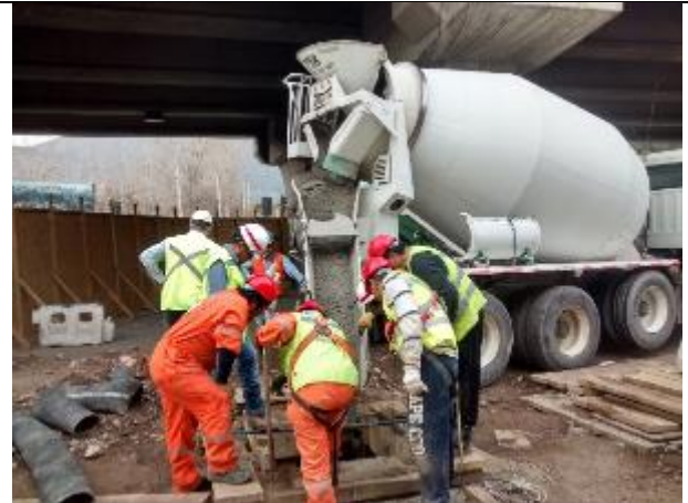
Primer hormigonado de pilas de fundación de cepas del viaducto El Salto, corresponde a pila 2 de Cepa 2.