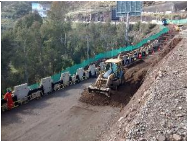
Colocación de capa de relleno estabilizado