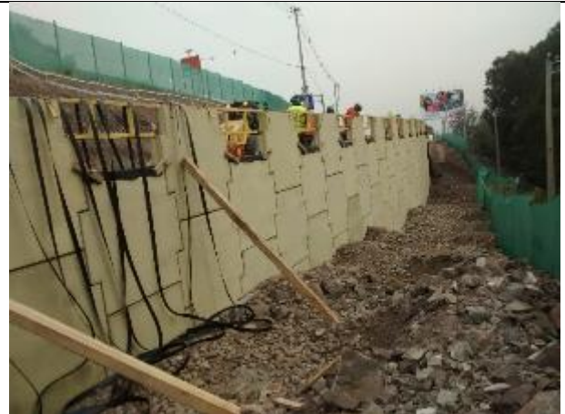
Vista de la altura de las placas de muro ocho instaladas