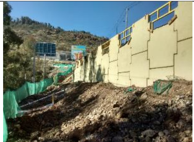
Escamas colocadas entre los Dm 80 y 190