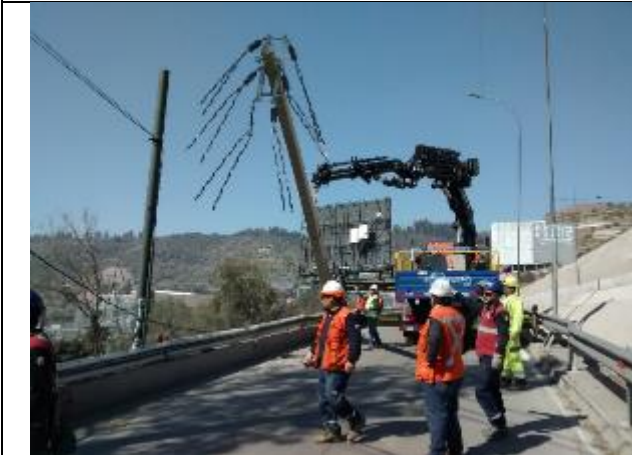
Instalación de un poste de 15mts para transporte de suministro eléctrico.