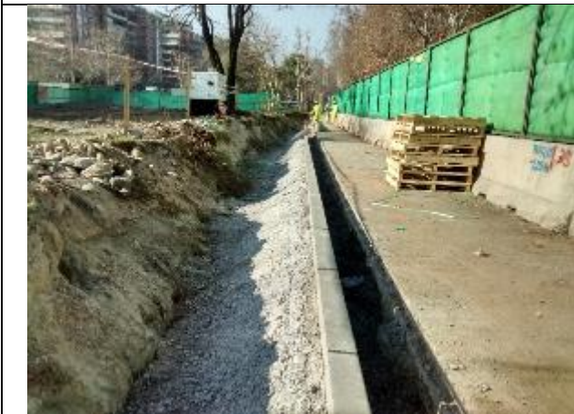
Instalación de las primeras soleras, sector de cambio de matriz de agua potable