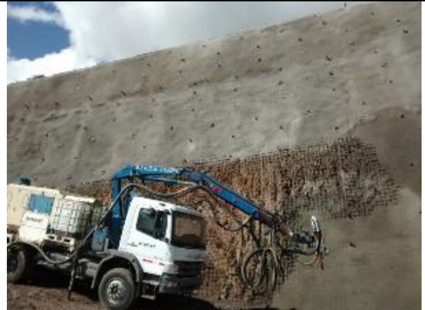
Colocación de la última faja de protección de Schotcrete en talud lateral al Portal Norte del Túnel.