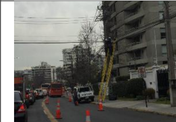
Trabajos de reparación de luminarias