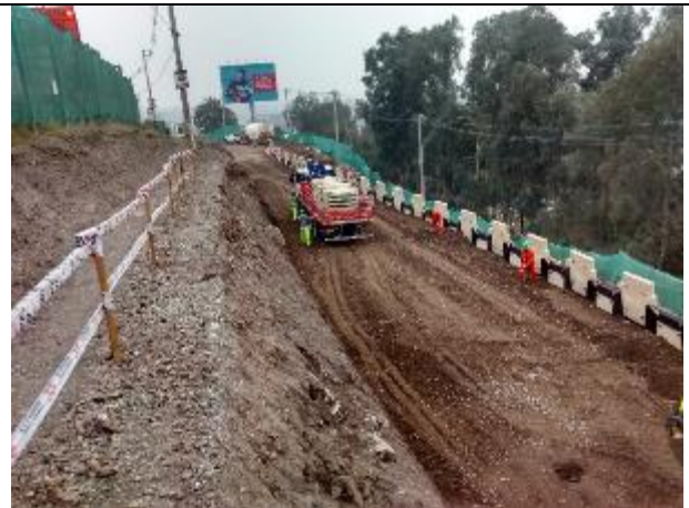
Colocación de capa de relleno estabilizado