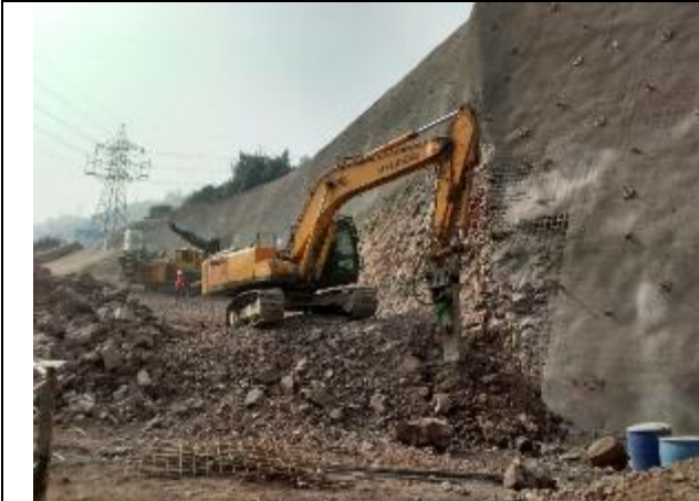
Excavadora con martillo neumático realiza demolición de material en sector al lado del Portal