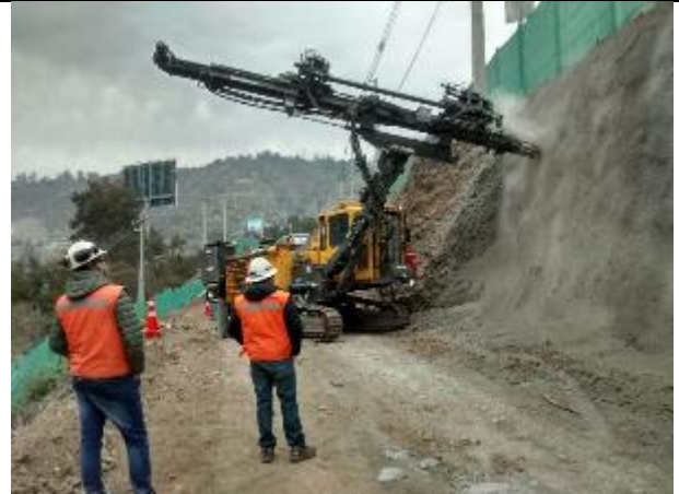
Perforación para colocación de pernos de 3mts y distanciamiento 2mts en horizontal