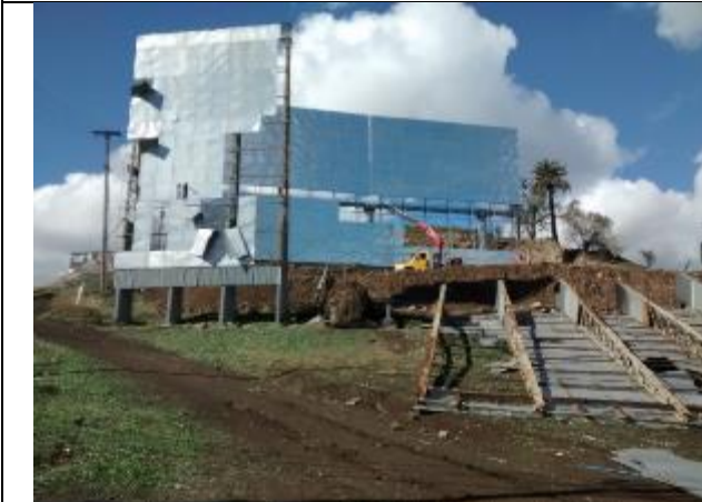
Traslado de letrero publicitario, sector del eje 21.