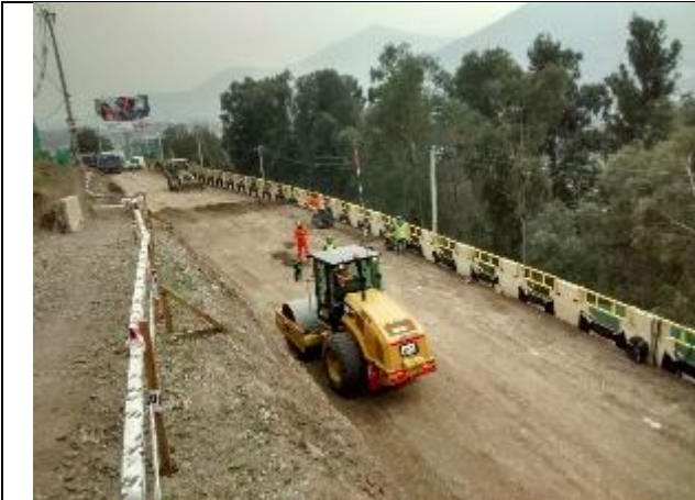
Vista panorámica de los trabajos del muro ocho.