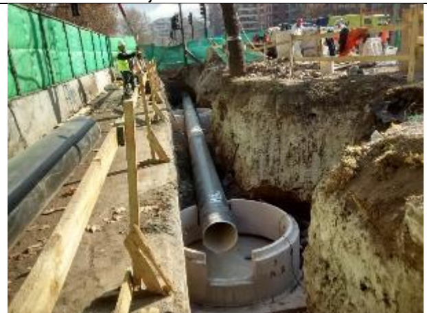
Cambio de Servicios Matriz Aguas Andinas