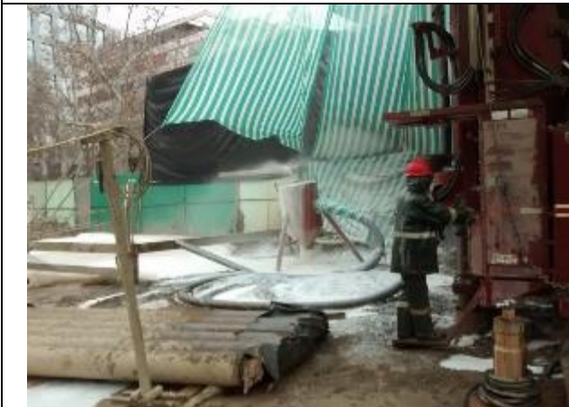
Pozo N°04, maquinaria trabajando con normalidad