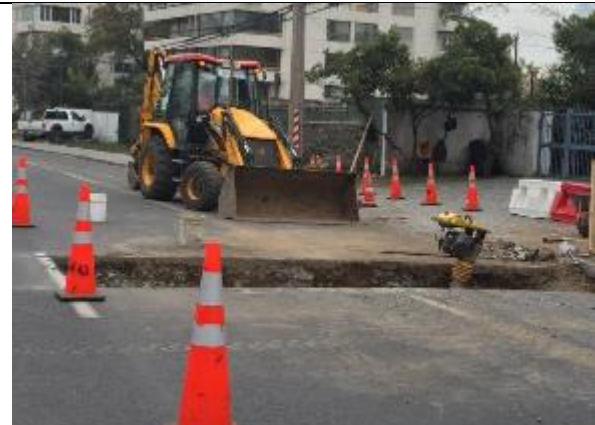
Trabajos de reparación de baches Vitacura