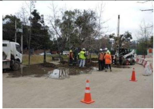
Traslado de árboles Comuna de Vitacura