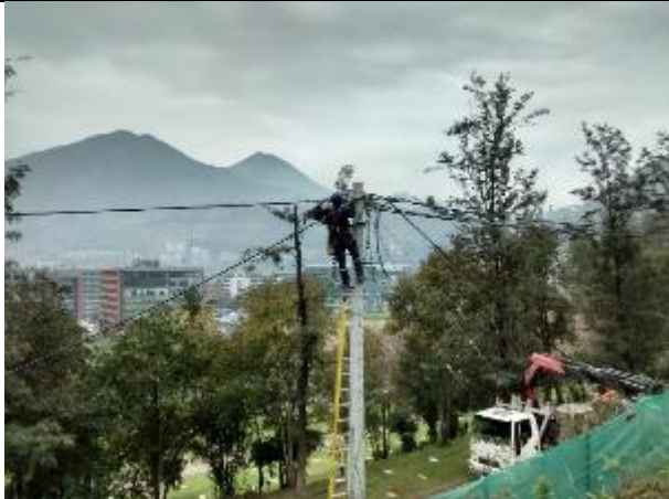
Trabajos en el cambio de servicio eléctrico