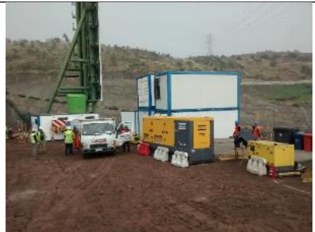
Implementación de instalación de Faena del Portal Norte del túnel.