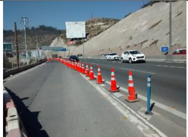
Conos instalados para suspensión del tránsito a Ciudad Empresarial, habilitado provisoria por El Salto