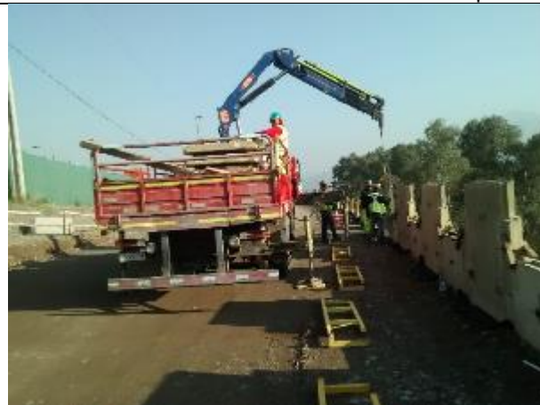
7.09.18 Proceso de descarga e instalación de escamas del muro TEM número ocho.