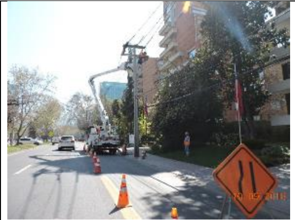
Mantención de luminarias, Comuna de Vitacura