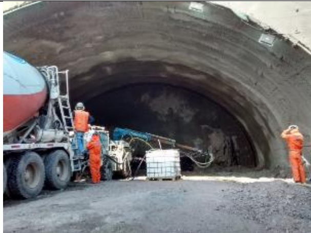
11.09.18 Se inicia la colocación de hormigón proyectado del marco.I.