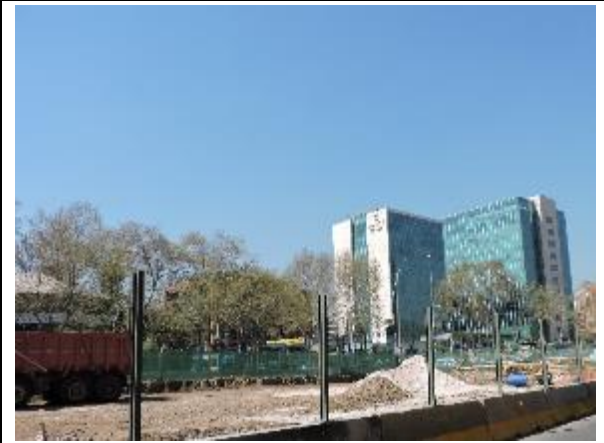
Trabajos en el interior del Parque Vespucio, Comuna de Vitacura