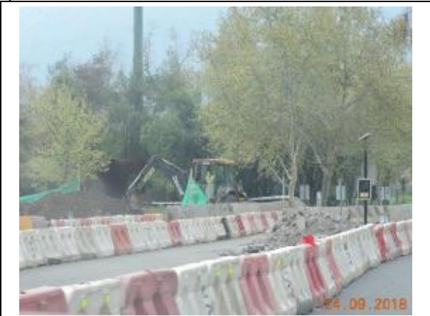
Trabajos en desvío de tránsito Punto Limpio Vitacura