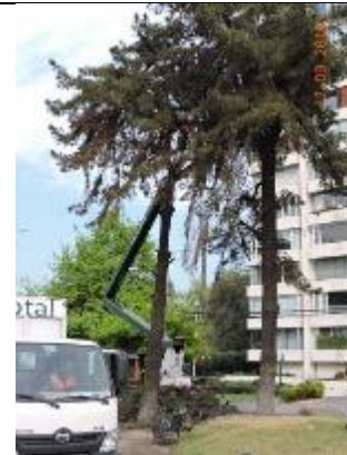
Trabajos de trasplante y tala de árboles, Comunas de Vitacura y Las Condes