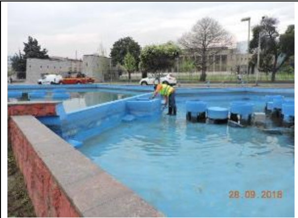
Mantenimiento de piletas, Comuna de Las Condes