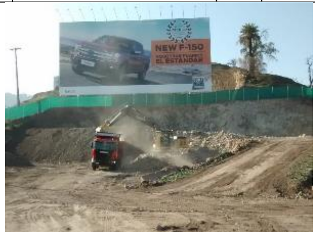
10.09.18 Se continúan con los trabajos de retiro de material del sector del eje 21.