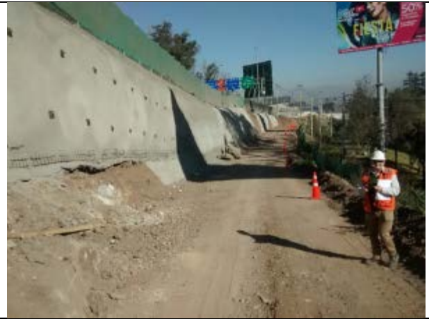
4.09.18 Revisión de talud reforzado de muro 8.