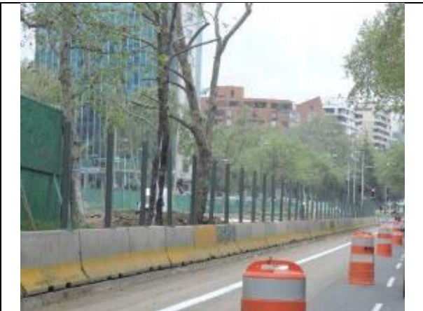
Habilitación de ciclovías Lado oriente y Poniente, Comuna de Vitacura