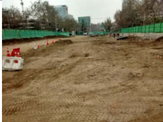
5.09.18 Sector entre Dm 3780 y 3865 (Espoz), ya fue realizado retiro de material de escarpe.