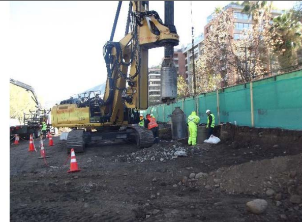
21.09.18 Excavación Pilotes sector 2