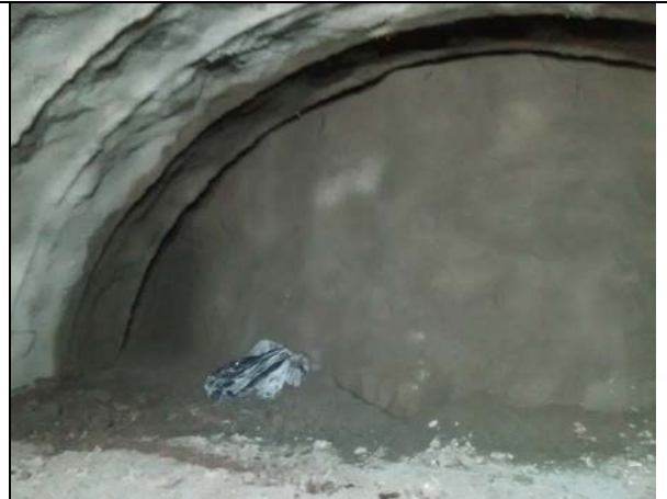
13.09.18 Frente de Túnel Sostenido vista nocturna