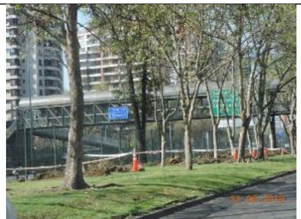
Trasplante de árboles Ramal 5 A Kennedy frente a Centro Comercial, Comuna de Las Condes