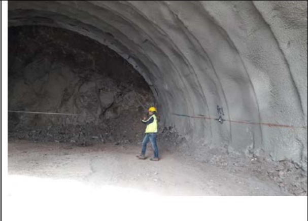
24.09.18 Excavación Túnel AVO.