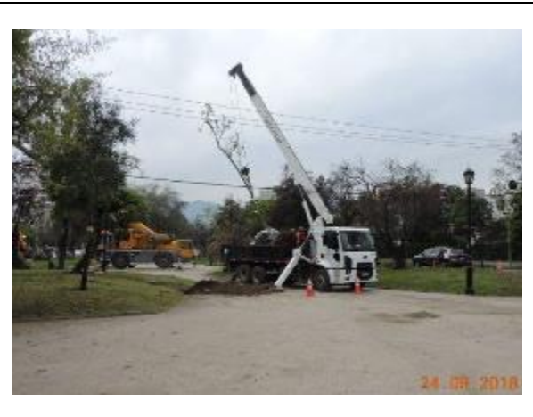
Trabajos de trasplante y tala de árboles, Comunas de Vitacura y Las Condes