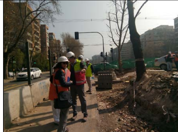
6.09.18 Inspección con SC AVO, UMAT y Div. Const de DGC de obras Parque Vespucio