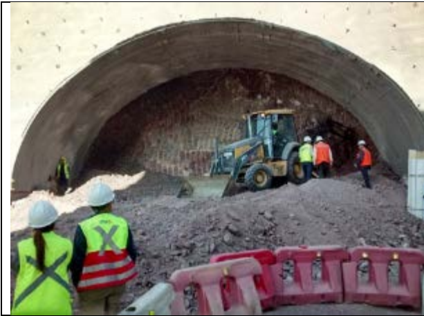
3.09.18 Trabajos de excavación túnel iniciados hoy.

A continuación se muestra la labor de fiscalización de la Inspección Fiscal sobre la faja: