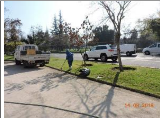
Riego y mantención del Parque Vespucio, Comuna de Las Condes