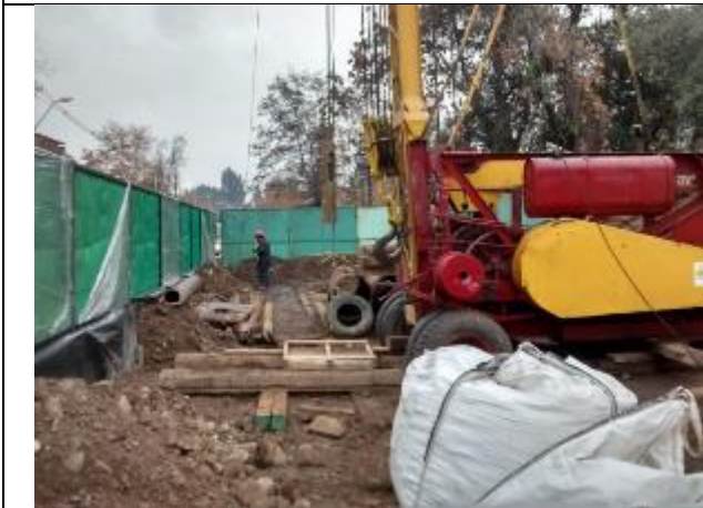
Pozo N°1 instalación máquina perforadora percutora