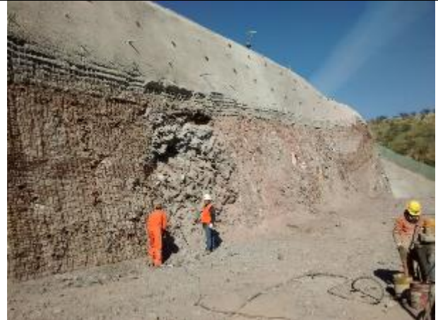
Instalación malla Acma, y pernos de 6mts largo, en perforaciones de 9mts y posterior lechada.