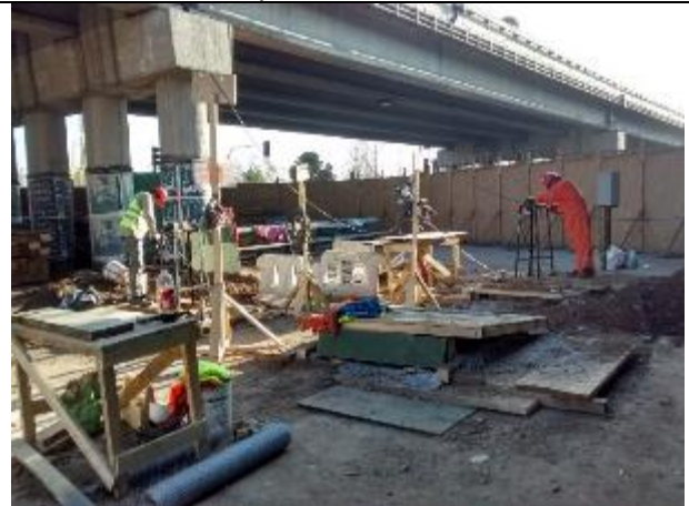
Cepa N°02, trabajos de excavación manual