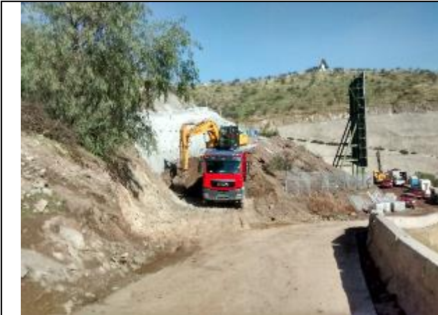
Excavadora carga camión con material de sitio al costado izquierdo del Portal Norte del Túnel