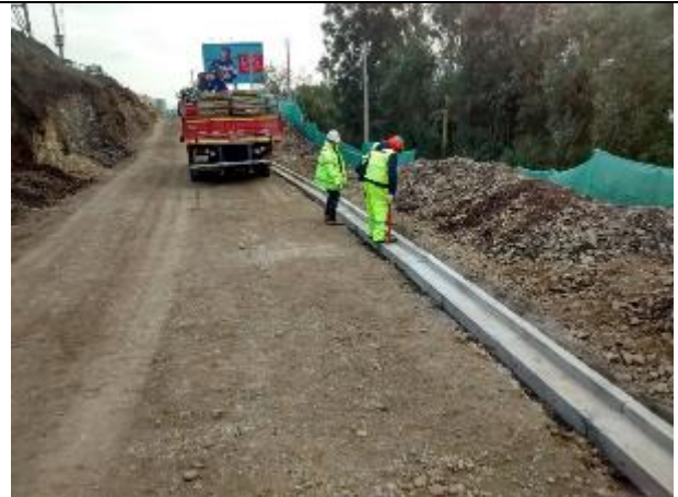
Se consta la colocación de soleras entre el Dm 129 al 165, inicio de primer tramo del muro TEM