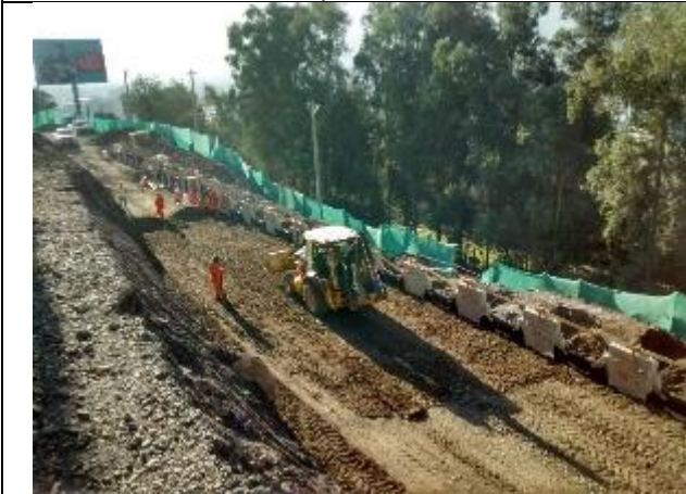
En Sector Muro TEM se inició colocación de capas de estabilizado para luego colocar cintas.