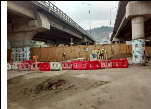
Vista panorámica de Construcción de 04 pilas de la cepa N°03.