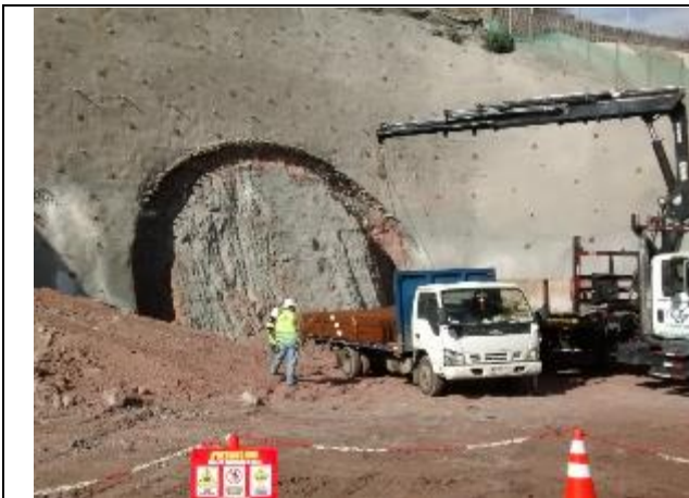
Portal Norte Túnel