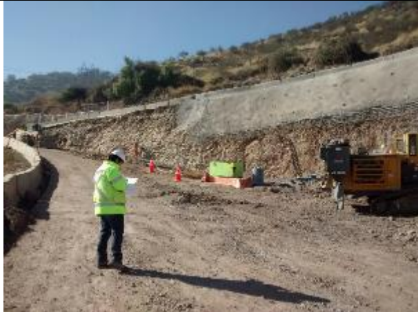
Vista panorámica de la excavación al costado izquierdo del portal norte