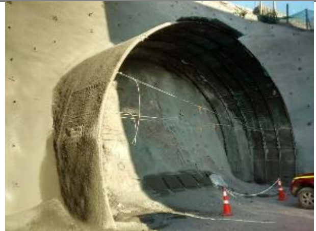
Vista de la construcción del marco del Túnel falso del Portal del Túnel Norte