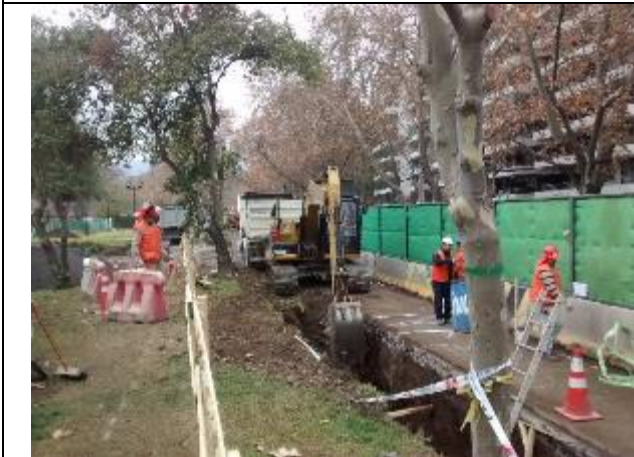
Excavadora ejecuta trabajos para el cambio de matriz de agua potable entre Candelaria y Espoz