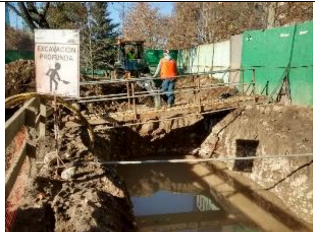
Pozo N°04, maquinaria ampliando la piscina receptora de agua