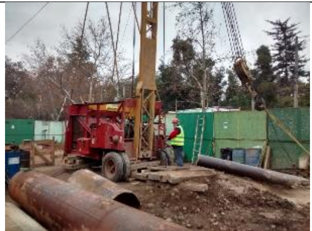
Pozo N°02 perforadora percutora trabajando