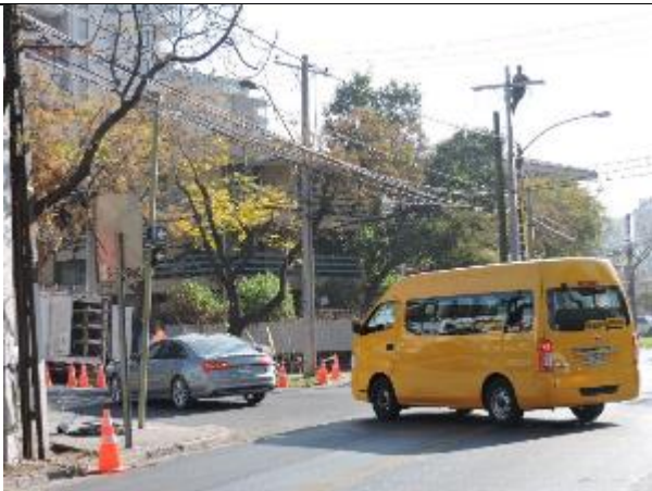
Cambio postación Enel.