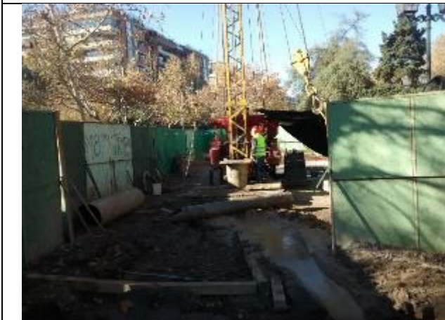
Pozo N°03 Profundidad 86mts.