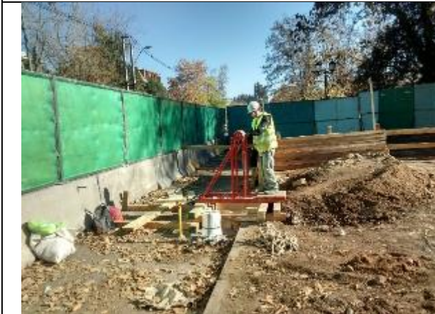
Pozo N°1 se inician los trabajos.