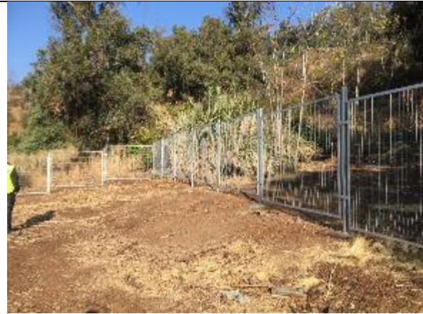
Revisión de cerco y despeje Lote N°6 Sector 1