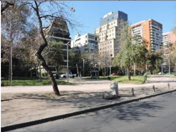
Se revisó la mantención de las áreas verdes del parque