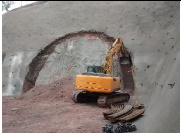
Excavadora ejecuta el remate fino del material faltante