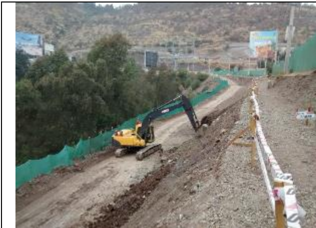
Perfilado talud Muro 8.