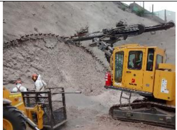
Portal Norte ejecución micro pilote N°39