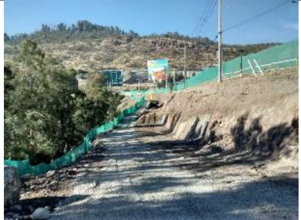
Instalación de postes para el Cambio de Servicio Eléctrico