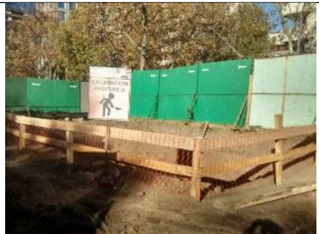
Pozo N°04, se terminó excavación