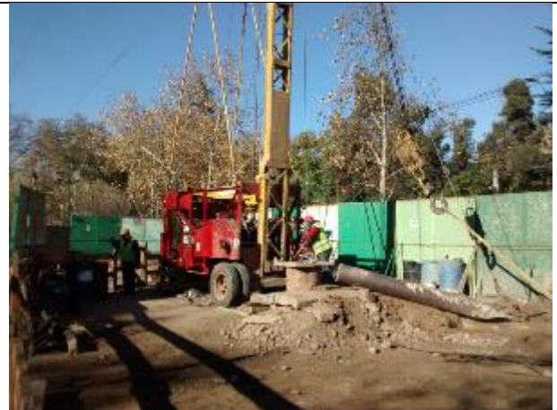
Pozo N°02 Profundidad 78mts