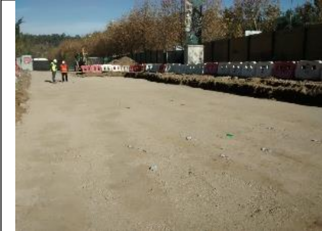
Traslado del Punto limpio, se excavo 1,6mts y que se rellenó 1,0mts.