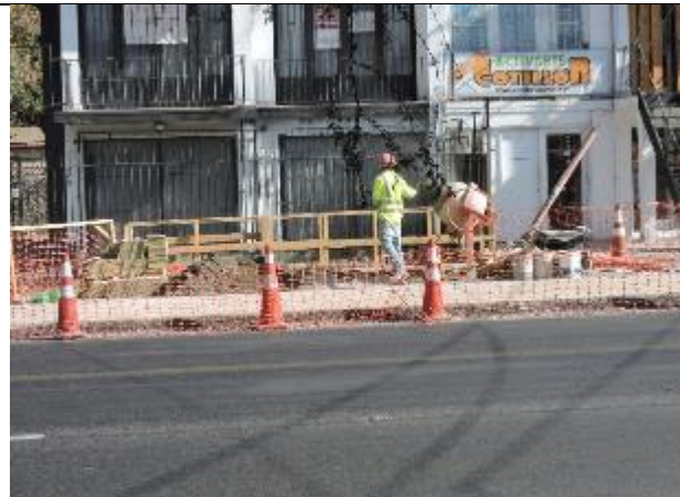
Reposición de aceras al llegar a Príncipe de Gales