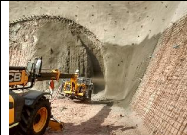
Hormigón proyectado (Shotcrete) en portal norte y sus costados.