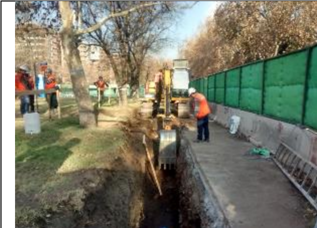
Excavación para el cambio de matriz de Agua Potable entre Candelaria y Espoz.