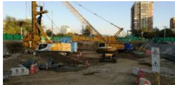
Trinchera sector Presidente Riesco – Hamlet, Dm 5.550