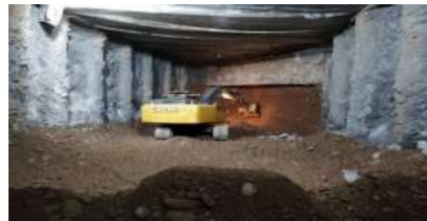
Construcción Ramal 5 (eje 43) Dm 165