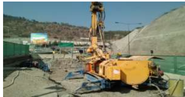
Viaducto El Salto- Sector Cepa 23, Dm 450