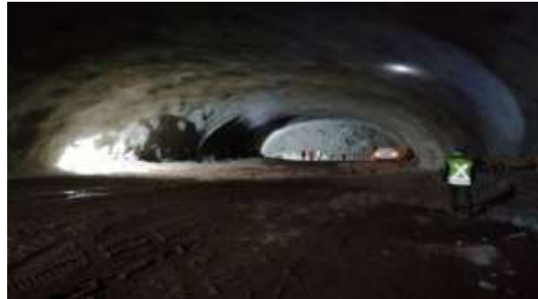
Túnel Minero Portal Norte – Sector Caverna, Dm 1.094