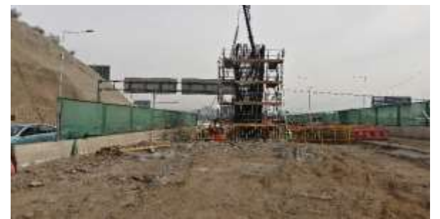
Viaducto El Salto- Sector Cepa 22, Dm 360,894