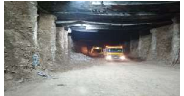
Excavación bajo Losa 33 hacia Losa 24 (Nivel -1) Trinchera Vitacura (Tramo entre Candelaria y Francisco de Aguirre)