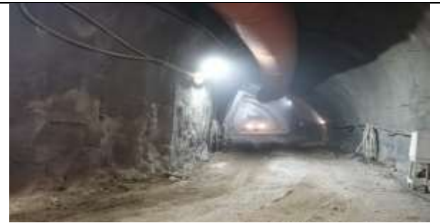
Túnel Acceso Sur – Inst. Marco 86, Dm 2.611