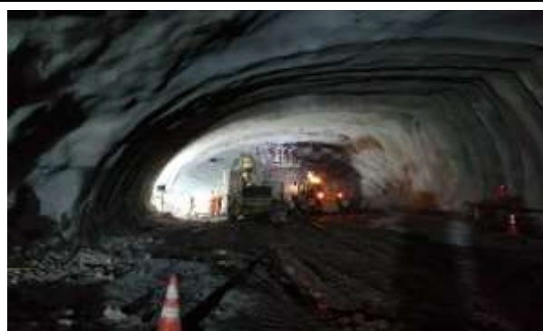
Túnel Minero Portal Norte – Sector Caverna, Dm 1.189,55