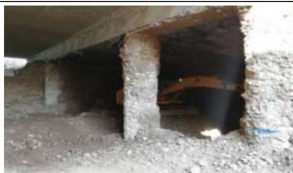
Construcción Ramal 5 (eje 43) Dm 165