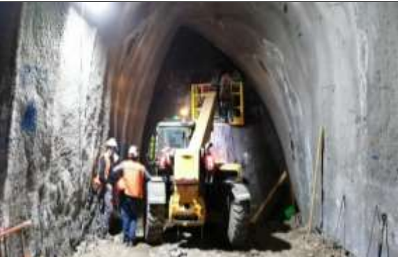
Túnel Acceso Sur – Inst. 1° Marco, Dm 2.664,25