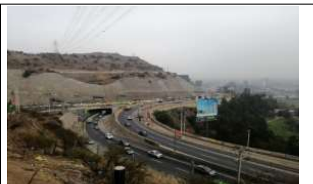
Viaducto El Salto- Sector Cepa 26, Dm 560,26