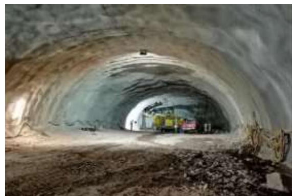
Túnel Minero Portal Norte – Sector Caverna, Dm 1.118,75