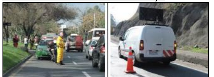
Fiscalización mantención luminarias: