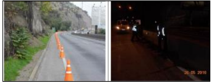
Fiscalización desagües y limpieza de calles:

Fiscalización de limpieza y aseo de La Pirámide: