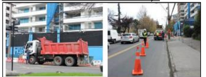
Fiscalización atención accidentes en la faja: