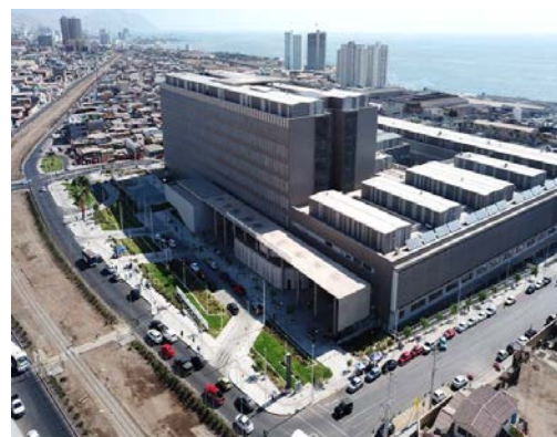
Hospital de Antofagasta