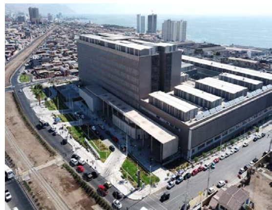
Hospital Regional de Antofagasta