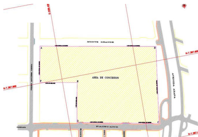
Emplazamiento Área de Concesión