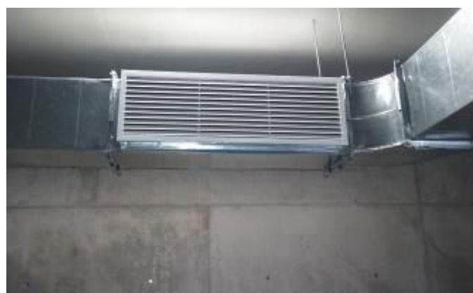
Rejilla extractora de sector estacionamiento de nivel -1