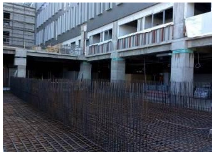
Avance estructura losa de aljibes tramo restante