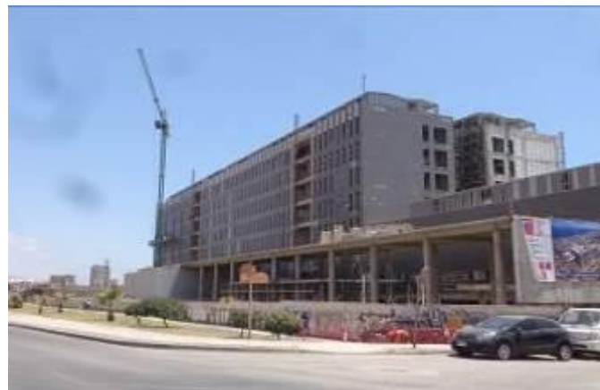
Obra gruesa TH