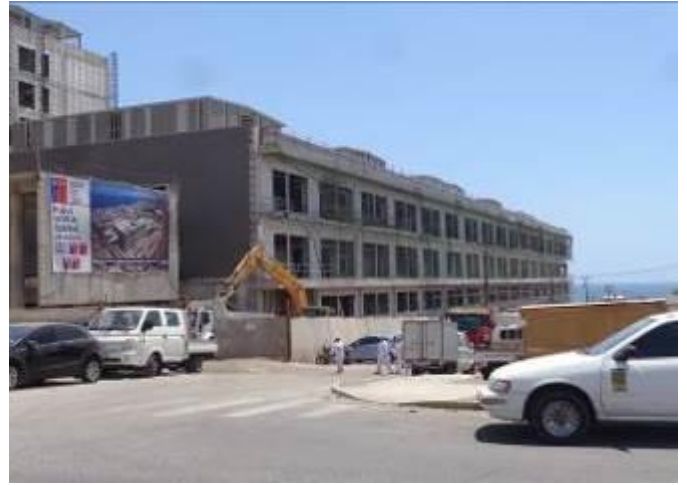
Obra gruesa en edificio CDT