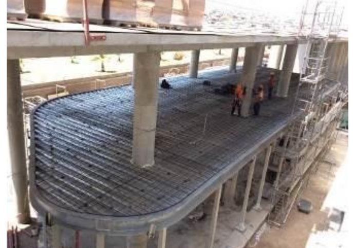
Avance losa con placa colaborante de cafetería