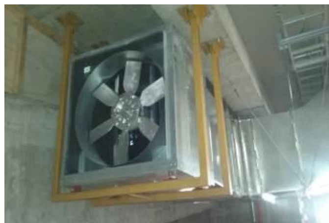
Ventilador extractor de 6000 [l/s] de sector estacionamiento, nivel -1 (urgencia)

En el sector del 3 er piso UCI se han instalado redes de gases clínicos en forma vertical con el objeto de avanzar entre las demás instalaciones