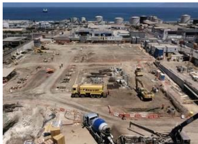
Movimiento de tierra y hormigonado de fundaciones en sector de estacionamientos