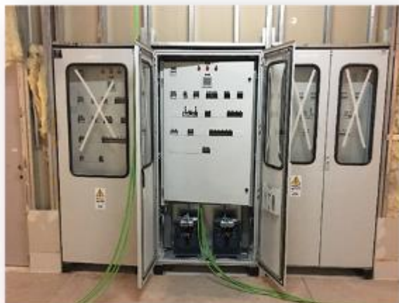
Tablero Distribución Pabellones en 3er Nivel de UPC

Se ha comenzado a trabajar en el montaje y conexionado de equipos y tableros generales en el Centro de Transformación 2 (CT 2), también se ha comenzado con el montaje y conexionado de tableros de distribución en los cuartos eléctricos de cada edificio.