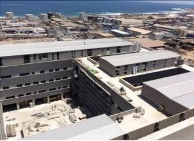
Obra gruesa en edificio UPC