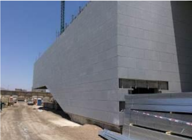
Avance obra gruesa y revestimiento auditorio