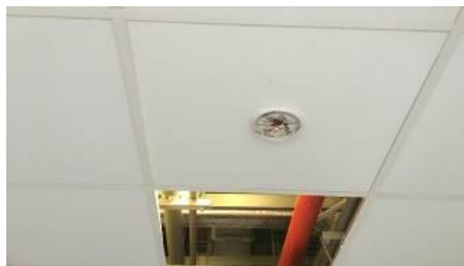
Montaje de bases de detectores de humo en cielos falsos

Se continúa con el avance en el nivel N +1, N +2, N +3 de todos los edificios con la instalación y conexión de las bases de los sensores de humo, además de los módulos relees encargados de dar la señal de cierre a los dâmperes corta fuegos.