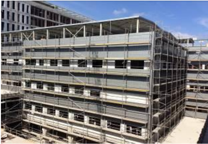
Obra gruesa sector UPC