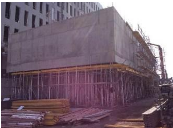
Hormigonado Muro Auditorio