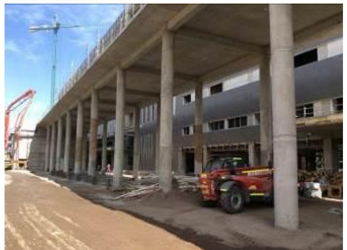
Obra gruesa Cafetería