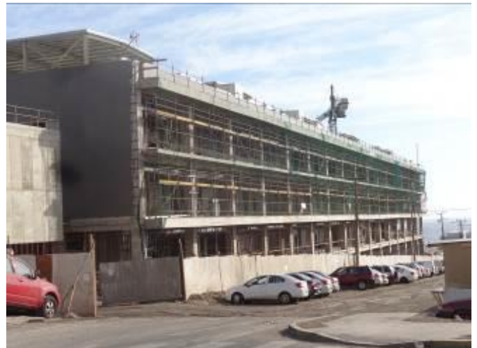
Obra gruesa en Edificio CDT