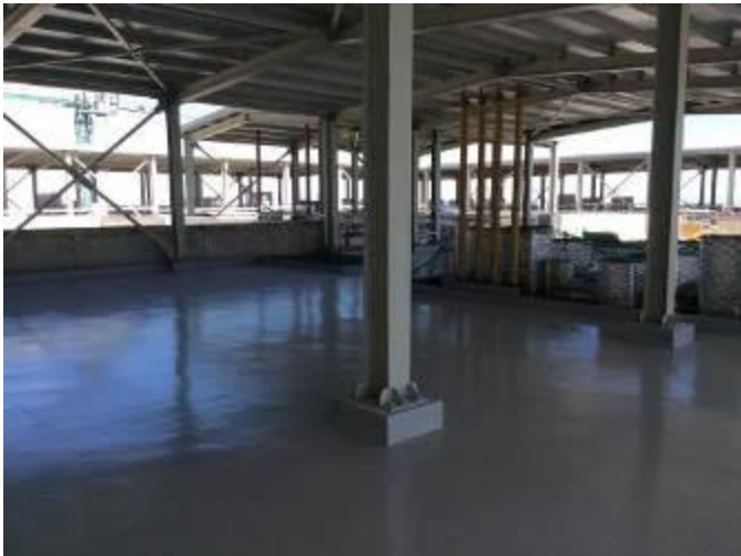
Avance pintura salas técnicas Edificio UPC