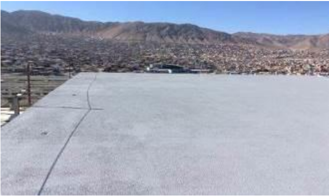
Aplicación impermeabilización helipuerto