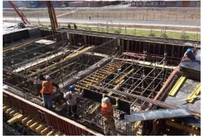
Avances en armaduras sector de Auditorio