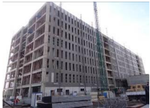
Obra gruesa TH