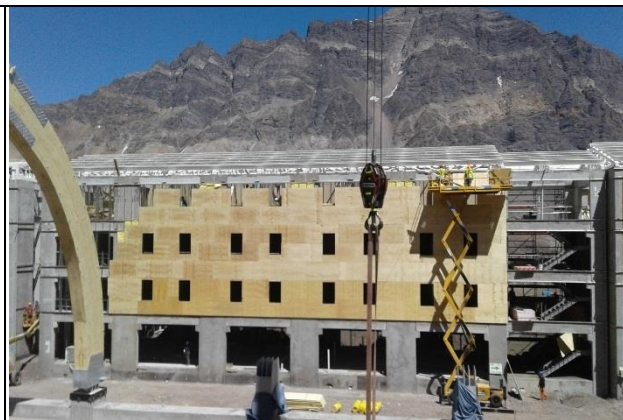
Instalación de fachada - Edificio de Alojamiento