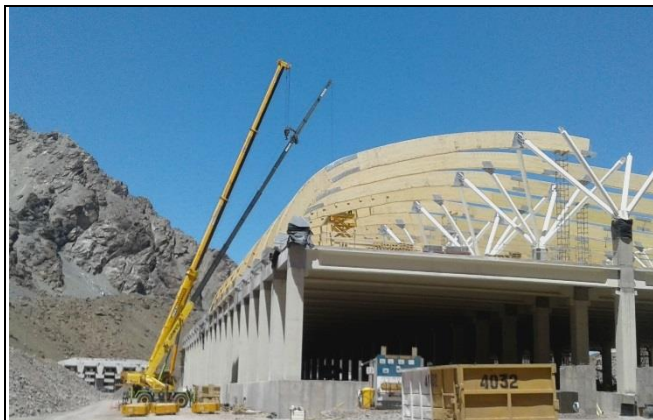
Estructuras - Edificio de Control y Servicios