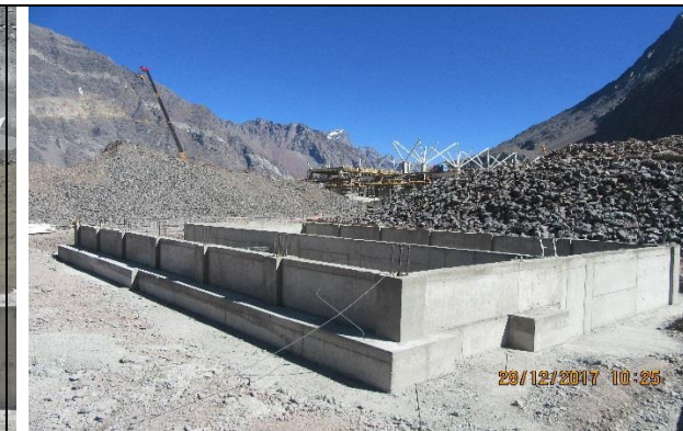
Estructuras – Planta de Tratamiento