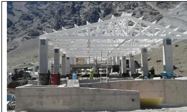
Estructuras con techumbre parcial – Edificio de Carabineros