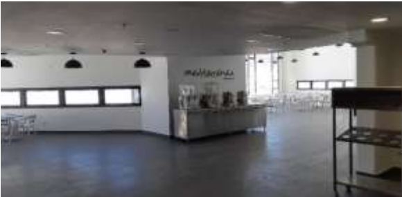
Edificio Alojamiento- Casino