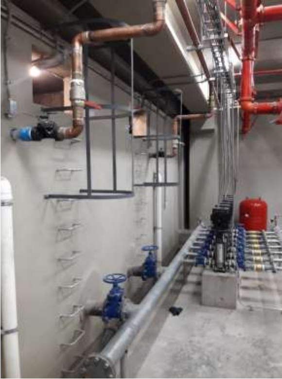
Edificio Alojamiento- Casino Funcionarios