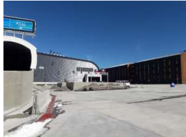
Edificio de Control y Servicios