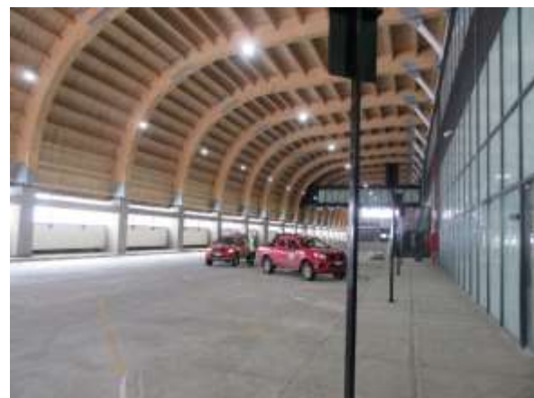
Edificio Control y Servicio