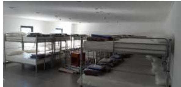
Edificio de Alojamiento- Habitación