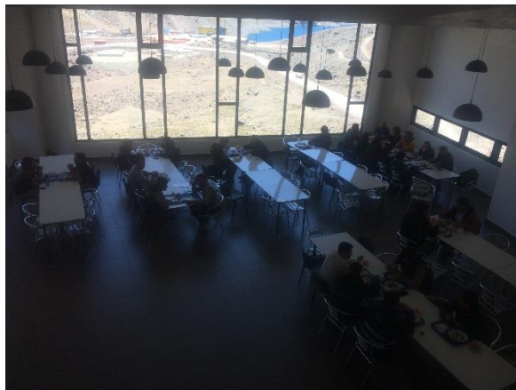
Casino Edificio Alojamiento