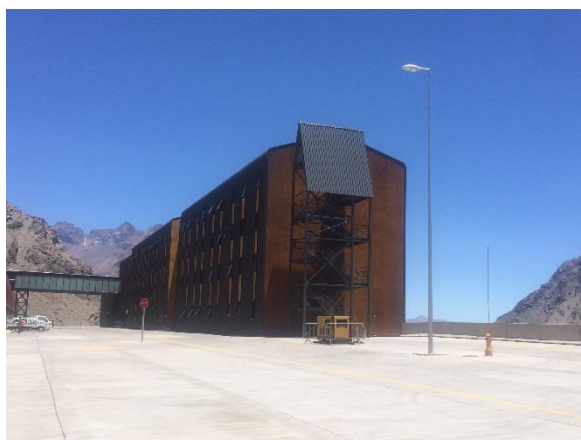
Montaje de escale Edificio Alojamiento