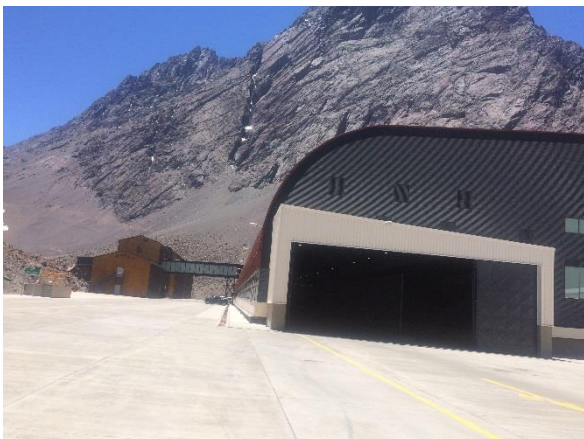
Edificio Control y Servicios pasarela con Ed. Alojamiento