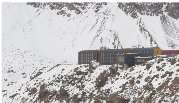
Edificio de Alojamiento