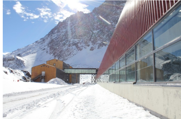
Pasarela entre Edificio Alojamiento- Control de Servicio