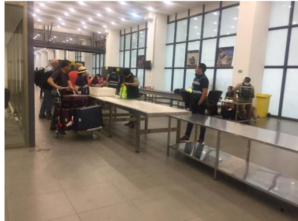
Edificio Control y Servicios – Transporte de Equipaje