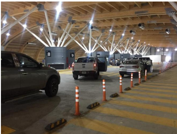
Edificio Control y Servicios – Control vehículos livianos