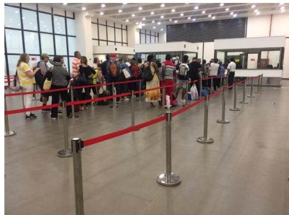
Control de Ingreso - Edificio Control y Servicio