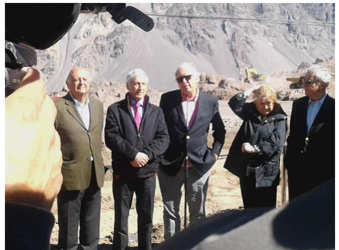
Fotografía: Ministro del Interior y los cancilleres Chile y Argentina.