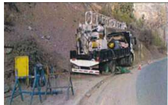
Sondaje en Sector La Isla