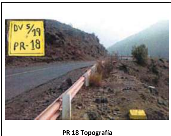
PR 18 Topografía