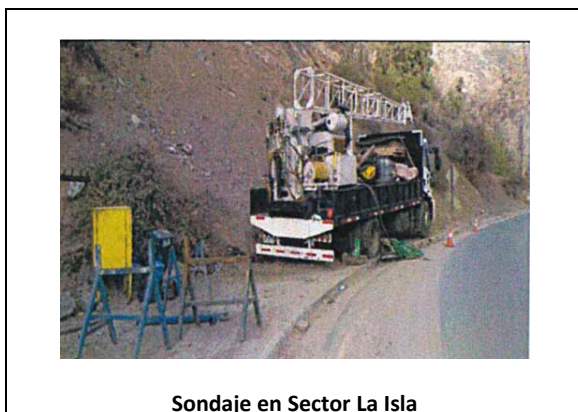
Sondaje en Sector La Isla