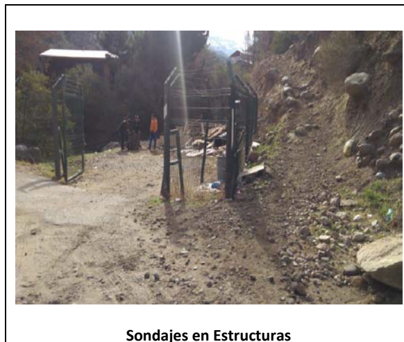
Sondajes en Estructuras