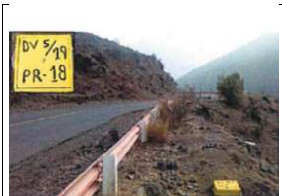
PR 18 Topografía