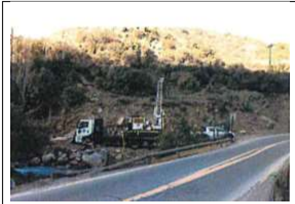
Sondaje en Sector Yerba Loca