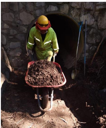
Imagen N°9 Limpieza de alcantarillas