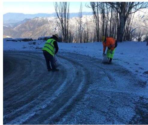
Imagen N°5 Aplicación de sal