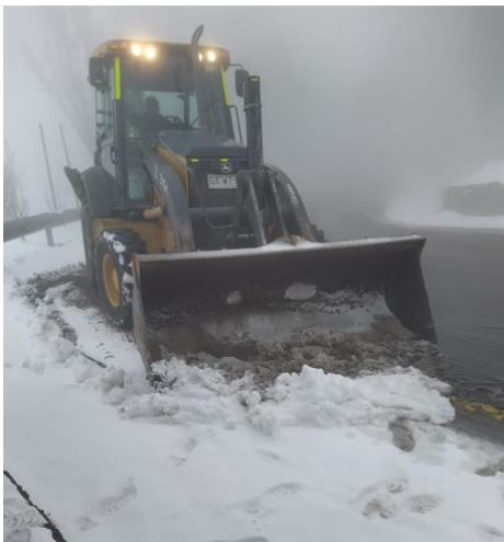
Imagen N°3 Retiro de nieve