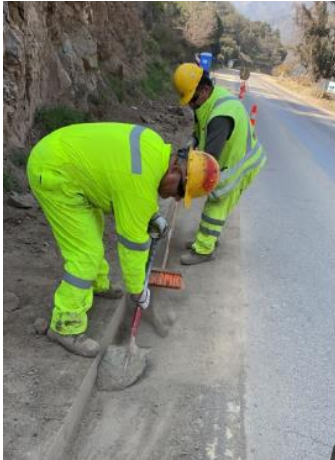
Imagen N°1 Limpieza de cunetas