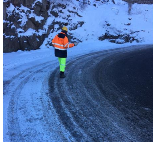
Imagen N°4 Aplicación de sal