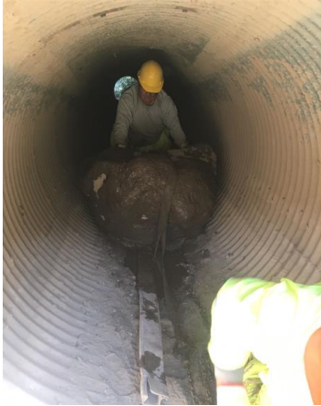
Imagen N°7 Limpieza de alcantarillas