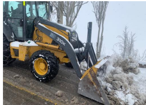
Imagen N°6 Retiro de nieve