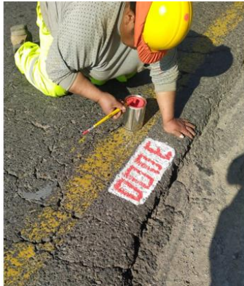
Imagen N°8 Balizado