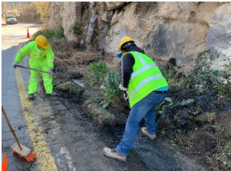
Imagen N°2 Limpieza de cunetas