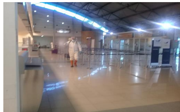
Sanitizado dependencias Terminal Aeropuerto Carlos Ibáñez del Campo.