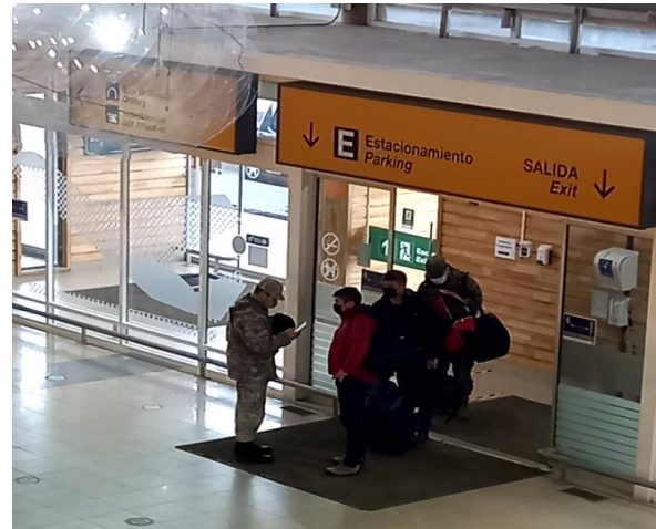
Control militar Protocolo COVID, en ingreso Terminal Aeropuerto Carlos Ibáñez del Campo.