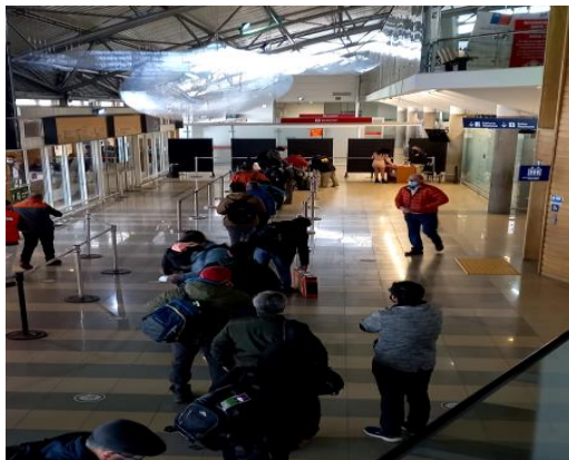
Fila espera control PDI Salud Protocolo COVID pasajeros antes de embarcar Terminal Aeropuerto Carlos Ibáñez del Campo.